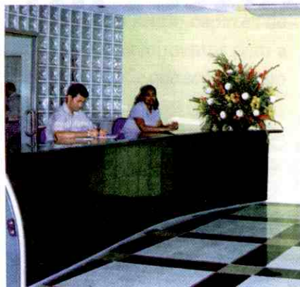
SPC: em novo local e novas instalações

A importância do Serviço de Proteção ao Crédito (SPC) para o comércio e a sociedade em geral vem crescendo, a cada dia, e com isso aumenta, também, o número de serviços disponíveis que o lojista pode acessar, gerando maior dinamismo e confiabilidade na concessão de créditos.