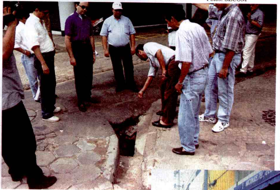
Empresários e técnicos da Prefeitura de Teresina percorrem o centro da cidade e analisam a atual situação das ruas e calçadas.

A partir desse levantamento inicial a Prefeitura vai apresentar um projeto de custos aos empresários teresinenses, com o objetivo de conseguir do empresariado local a parceria necessária para o trabalho, a exemplo do que aconteceu em outras capitais. O Projeto de Revitalização do Centro inclui, também, a construção do Shopping Teresina, até o ano